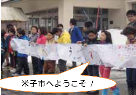
米子市へようこそ！