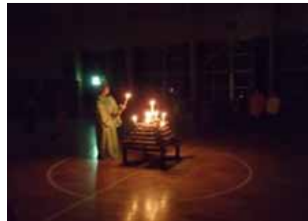
キャンドルサービス