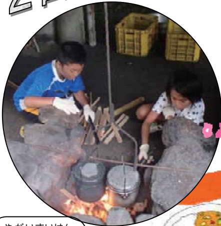
やがいすいはん 野外炊飯