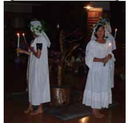
夜はキャンドルパレード