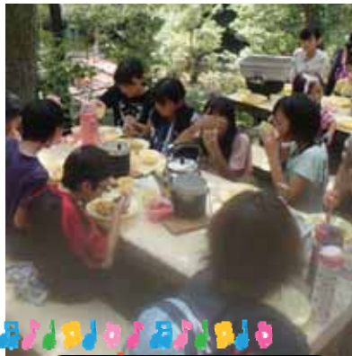
カレーのできあがり~