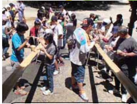
お昼はそうめん流し!! 緊張もほぐれ みんなニコニコ楽しそう