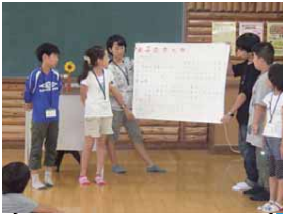
みんなで米子の紹介をしたよ