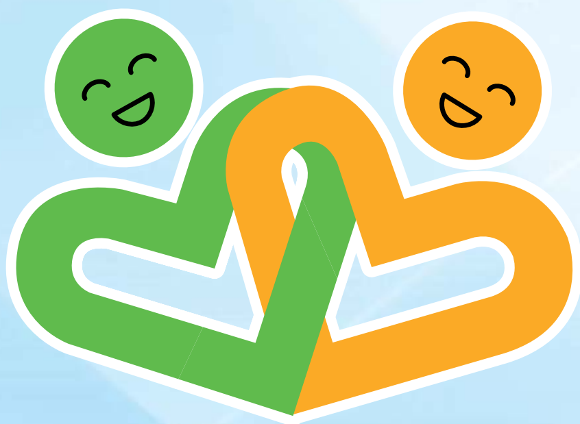
米子市人権啓発シンボルマーク