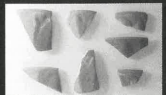
龍泉窯（中国浙江省）青磁