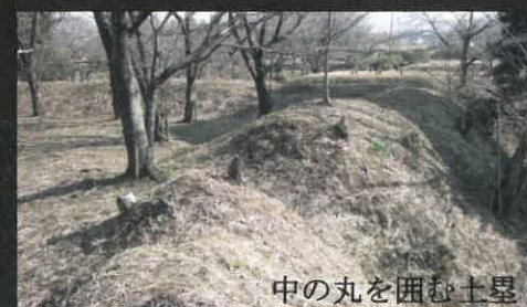
中の丸を囲む土塁

尾高城は、丘陵を利用した立地から、北、西側は約20mの崖に守られ、大山山麓へ続く東側は堀と土塁で防備を固められていました。また、城内には、北側から二の丸、本丸、中の丸、天神丸、背後に越ノ前、南大首など8つの郭が配置されており、現在でも各郭を区画した空堀や土塁が残されています。