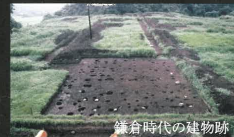
鎌倉時代の建物跡