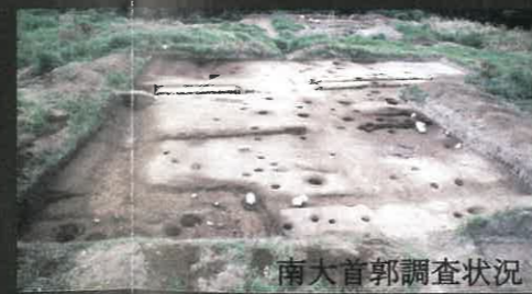
南大首郭調査状況

1974～79年に実施された発掘調査では、土塁、堀のほか、井戸跡、建物跡などが確認され、南大首の郭内では空堀に面して配置された櫓跡と考えられる掘立柱建物跡が確認されています。また、南大首の堀外からは、尾高城成立に関わる鎌倉時代の在地領主の館跡と推定される建物跡が確認されています。