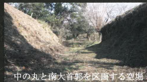
中の丸と南大首郭を区画する空堀