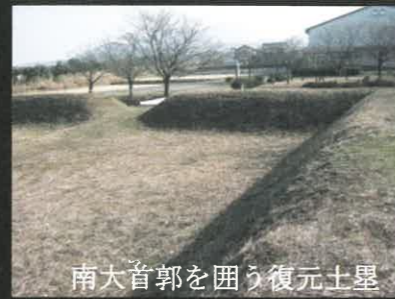
南大首郭を囲う復元土塁

四方を空堀に区切られた南大首郭は、発掘調査により南、東側に土塁が存在したことが確認され、東側の堀から橋脚の柱穴が発見されたことから、出入り口には木橋が架けられていたようです。