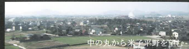
中の丸から米子平野を望む

尾高城の眼下には城下町が営まれ、天文19年（1550）の洪水によって流路が変更されるまでは、日野川が城下近く、現在の佐陀川の位置を流れていました。