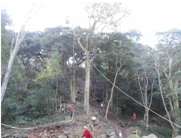
史跡米子城跡危険木伐採事業