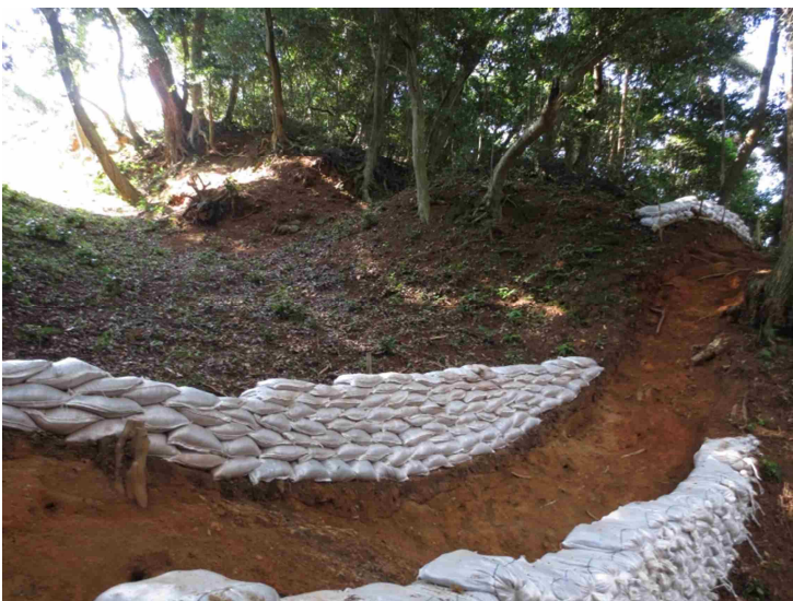
史跡米子城跡豎堀トレンチ調査状況