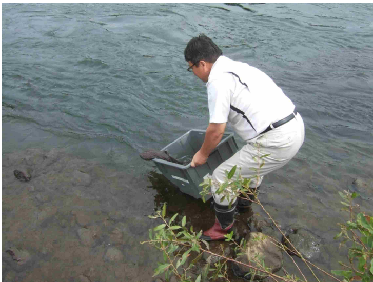
オオサンショウウオ放流