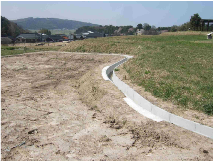
史跡上淀廃寺跡環境整備事業