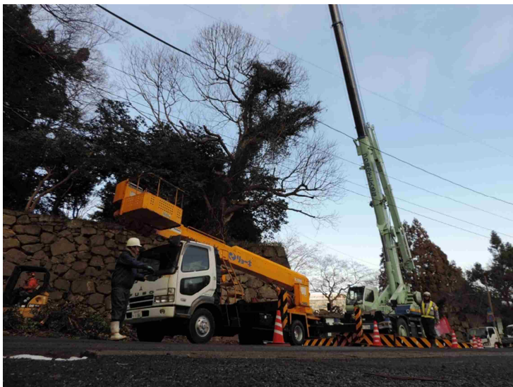
史跡米子城跡危険木伐採事業