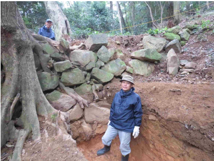
史跡米子城跡登り石垣