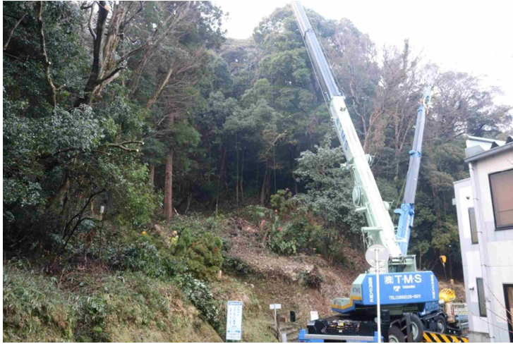
史跡米子城跡危険木伐採事業