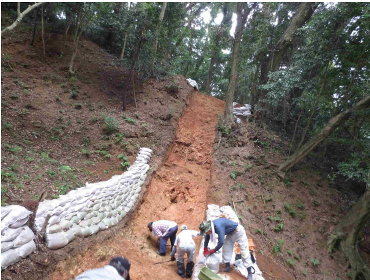
史跡米子城跡豎堀調査風景