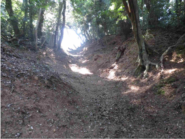
史跡米子城跡豎堀全景