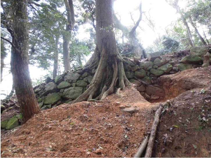
史跡米子城跡登り石垣