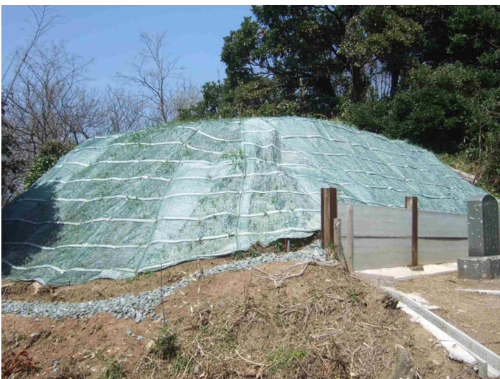
史跡向山古墳群（6号墳）保護工事