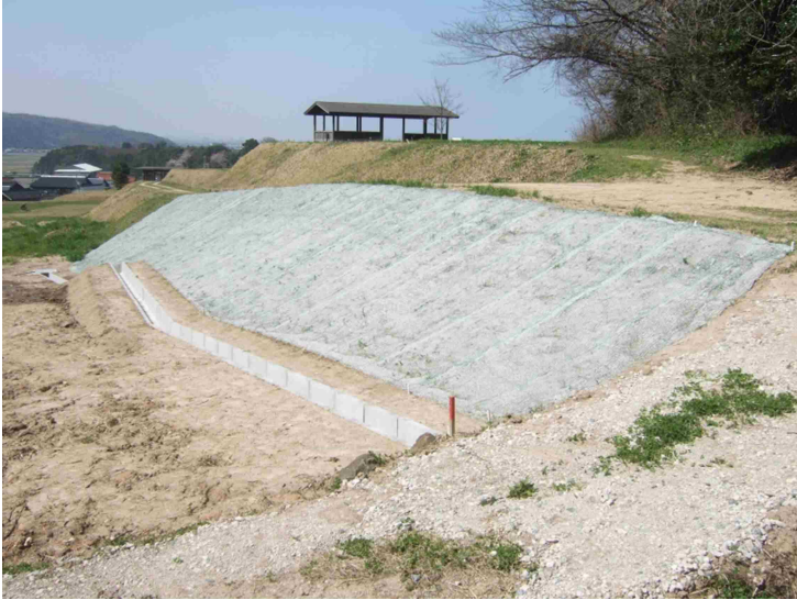
史跡上淀廃寺跡環境整備事業