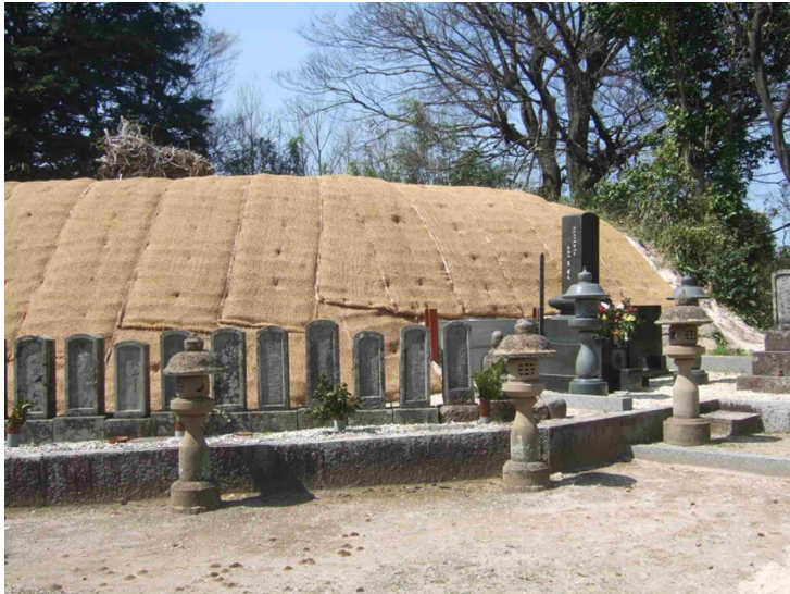
史跡向山古墳群（3号墳）保護工事