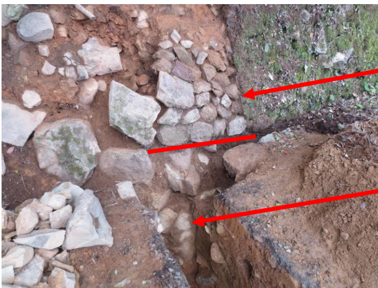
写真3 石垣の新旧積み直し状況