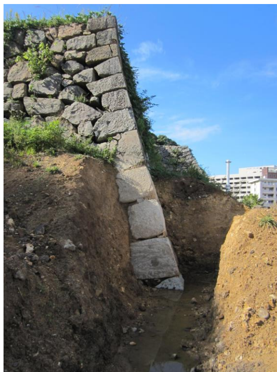
写真5 石垣の隅角部