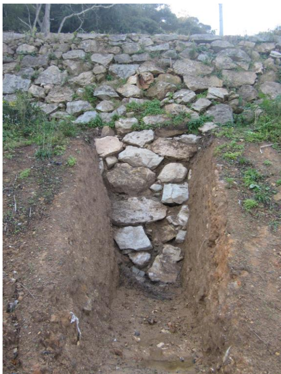
写真4 長屋門下の石垣

二の丸石垣の保存状態を確認する目的で、旧湊山球場スタンド撤去後の盛土を一部除去して石垣確認調査を行った。5地点を調査した結果、根石付近までの石垣を確認することができた。柵形の三の丸側は石材が脱落しており、現在見えている部分は外野スタンド設置後に積み直された可能性がある。その他の石垣は、良好に保存されていると見られる。