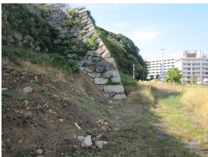
写真6 トイレ下の石垣隅角部