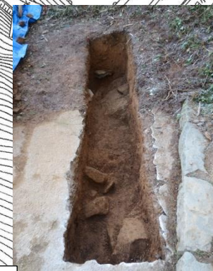
園路遺構確認調査