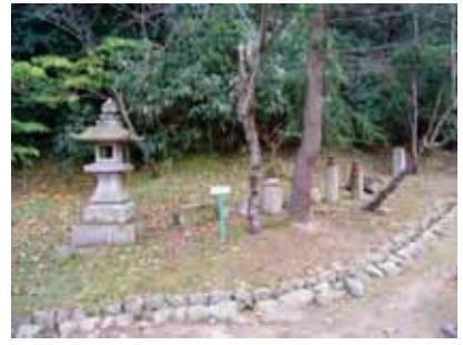
集積された石造物