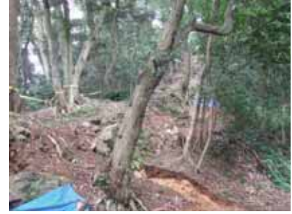
登り石垣に繁茂する樹木

ど基礎的な資料の収集がされておらず、石垣カルテを作成する必要がある。また、これに基づく経年変化の測定も必要で、適宜、石垣カルテの更新に努めることが重要である。