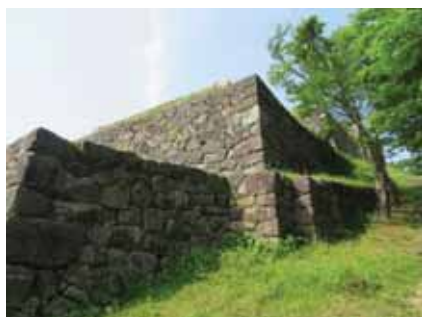
本丸石垣修理箇所