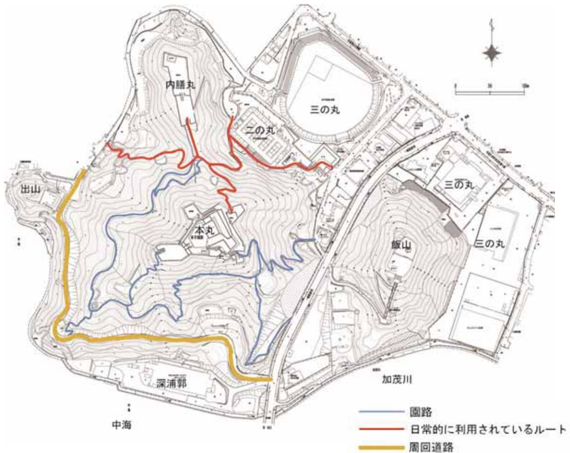
現況ルート利用図