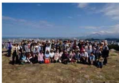
米子城を極める！（現地ウォーク） 平成28年10月2日

米子城跡を通して関連する都市との交流については、愛媛県大洲城、岐阜市黒野城、島根県富田城、鳥取城などの城跡が所在する都市、地域との連携の充実を検討することが必要であり、この交流を通して、米子城跡の新たな魅力の発見が期待される。