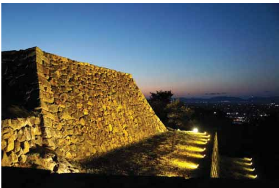
米子城跡ライトアップ 実施状況（平成28年9月）