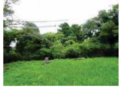
湊山方面への眺望