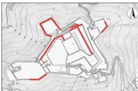
本丸石垣修理箇所

概要：平成12年10月6日に発生した鳥取県西部地震に伴う都市公園施設の災害復旧事業として、き損した石垣の修復工事を実施した。本丸の遠見郭、番所郭、本丸郭北側、控え郭、水手郭、内膳丸を中心に崩落、孕み出し、亀裂等のき損及び危険個所の石垣の積み直し等を都市公園震災復旧工事として行った。二の丸の庭球場を資材集積場とし、ここから園路に資材運搬用モノレールを設置し資材を現場に搬入した。バックホウは解体、運搬し、現場で組み立てた。また、遺構の残存が推定された部分について確認調査を実施した。