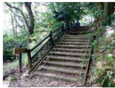
出山への木製階段