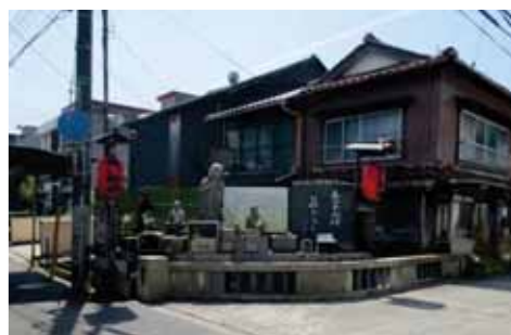
旧加茂川沿いの地蔵(咲い地蔵)

史跡米子城跡への理解の普及のため、シンポジウム、フォーラム、現地ウォーク等現在実施しているソフト事業をさらに充実させ、展開を図っていく必要がある。また、活用に資するための多目的広場の設置が必要である。さらに、史跡米子城跡とともに、城下町や日本遺産に認定された「旧加茂川沿いの地蔵」など、近隣にある多様な資源との連携による地域一体となった取組みを推進する必要がある。