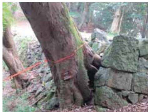
石垣に生える大木