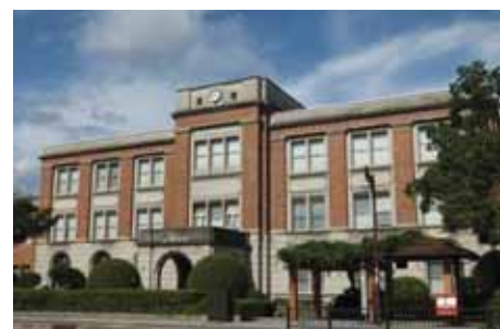
米子市立山陰歴史館

・樹木の繁茂により、天守、内膳丸など主要な郭からの眺望景観が阻害され、一方では、周辺地域からの天守などへの眺望景観も阻害されており、米子城の存在が認識できない。