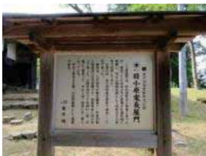
旧小原家長屋門説明板