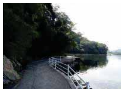
中海沿いの散策路