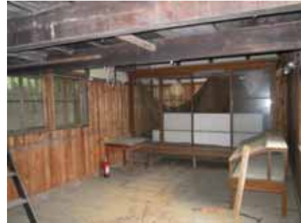
小原家長屋門内部の現況

城下（西町）にあった市内に残る唯一残る江戸時代武家関連建造物である旧小原家長屋門（市指定文化財）が移築されているが、老朽化のため内部は公開されていない。