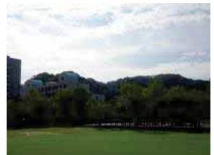
湊山公園から本丸・内膳丸を望む