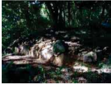
水の手郭下方で検出した石垣