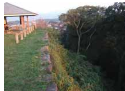
天守東屋の防止柵

天守の東屋南側に擬木による転落防止柵が設置されているが、経年劣化により、一部破損が見られる。また、それ以外の本丸、二の丸、諸郭などには転落防止柵は設置されていない。設置の必要性、景観への配慮、遺構への影響などを勘案し検討する必要がある。