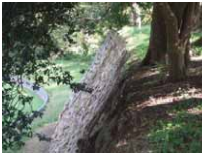
二の丸高石垣上の樹木

3) 石垣の孕み出しが著しい箇所は積み直しが必要となってくるが、石垣の実測図、写真な