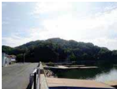
中海にかかる栈橋