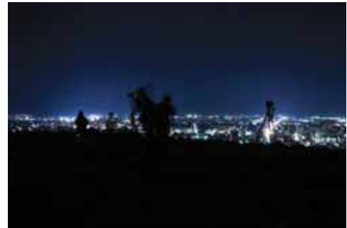
米子城夜景撮影会の様子