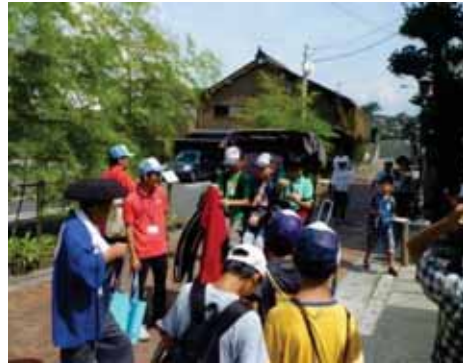
平成 23 年度郷土の歴史教室

加藤貞泰は治世 7 年間で伊予大洲へ転封となったが、その際、米子の商人や職人を大勢引き連れて移住しており、加藤氏は、明治になるまで大洲に在籍した。そのため、大洲には、現在も城主や米子から移った職人の子孫が存続し、米子姓を名乗っている家も 10 軒近くある。また、その家臣であった近江聖人・中江藤樹成長の地としての共通性や、「おせ」「がいな」など米子地方の方言との類似性のほか、少彦名を祭神とする栗島神社と大洲少彦名神社もあり、400 年の年月を隔てても、なお歴史的な繋がりが残っている。