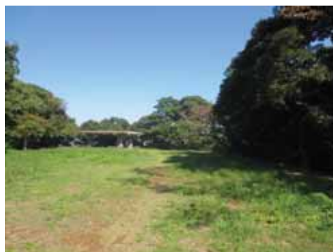
眺望のきかない内膳丸