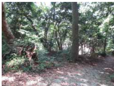
樹木がうっそうと茂る園路