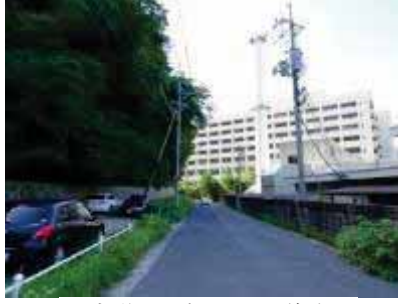
内膳丸山裾沿いの道路