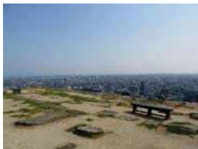
礎石展示・土系硬化舗装・ベンチ