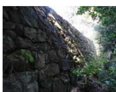
内膳丸石垣修理箇所