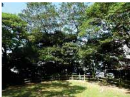
中海方面への眺望