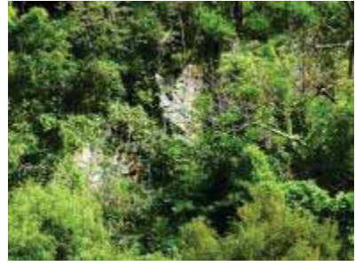
岩盤の落石防止ネット