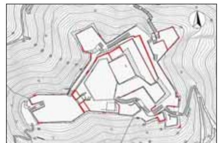
本丸石垣修理箇所

の遠見郭、控え郭、本丸郭東、水手郭、番所郭、内膳丸などの石垣の崩落、孕み出し、石材の抜け落ちなどのき損の多い箇所について解体し積み直しを行った。工事資材や石材は二の丸テニスコート付近から山頂へ230mに渡って張ったワイヤー索道を使い運搬した。また、遺構の残存が推定された部分について確認調査を実施した。補完石には、城山の石材と近隣では最も類似する米子市淀江町稲吉の凝灰岩を使用した。