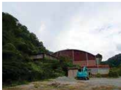
スポーツ施設裏側の空地