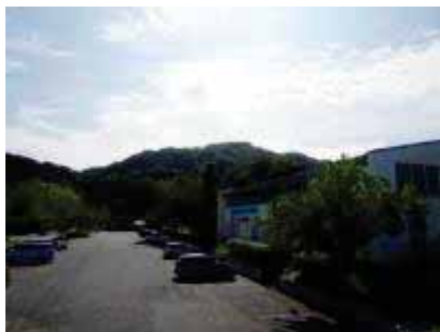
湊山公園駐車場と米子艇庫