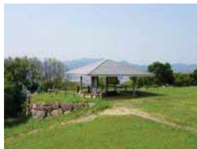
東屋(内部にベンチと説明板)