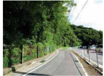
道路沿いの落石防止柵