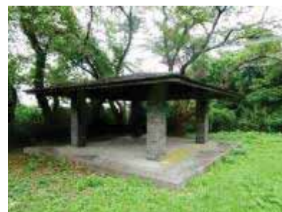
コンクリート製アズマヤ