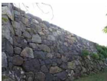
本丸石垣修理箇所