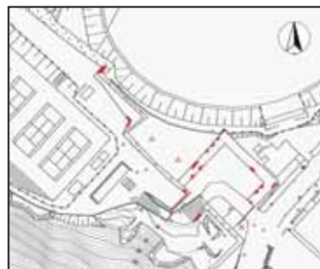
二の丸石垣修理箇所