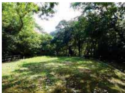
湊山方面への眺望