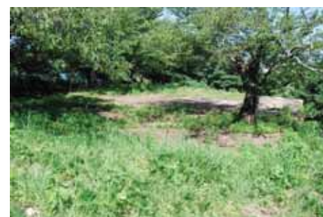
樹木が茂り眺望のきかない遠見櫓