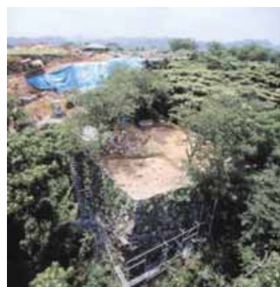
天守、遠見櫓石垣修理状況（平成13年）