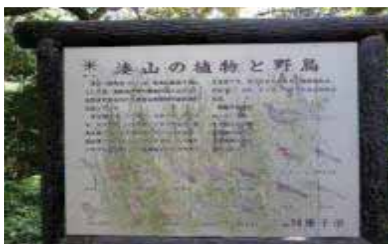
植物と野鳥の説明板