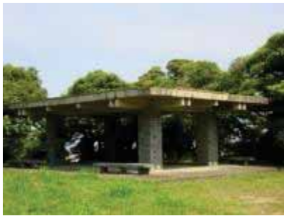
コンクリート製東屋とベンチ