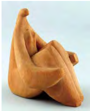
辻 晉堂《題不詳》木彫

当館初公開となる《榎本氏像》は、伯耆町出身の彫刻家・辻晉堂が39歳の頃の塑像作品です。木彫制作の際の創作意識を参考に、各パーツを抽象的な形態として解釈、再構築する手法により制作されており、辻が当時新たな表現の可能性を追求した形跡が見てとれる作品です。特に、「第34回日本美術院展」出品歴があり、辻の研究にとっても貴重な作品といえます。