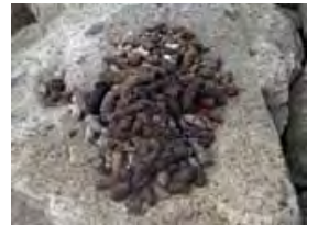
タヌキのためフン場

水鳥公園周辺を歩き回ると、時々動物のフンが1か所に山盛りになっていることがあります。これは「ためフン場」といって、水鳥公園周辺に住んでいるタヌキたちの共用トイレです。タヌキは行動範囲の中で他のタヌキと共通の場所にフンをする習性がある、仲間とのコミュニケーションの場になっています。そのフンの中身に注目すると、水鳥公園のタヌキの食生活が見えてきます。水鳥公園のタヌキのフンには、小型哺乳類の骨と毛、木の実の種がたくさん含まれていました。一見のんびりしていた印象のタヌキですが、動きが素早いネズミを捕えて食べているようです。また、タヌキのためフン場から木の芽が伸びているのを見たことがあります。タヌキは木の種の運び屋にもなっています。