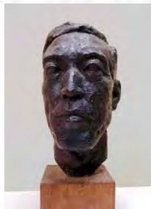
辻 晉堂《榎本氏像》1949年 ブロンズ

この2作品を含め、近年新たに収蔵・修復を行なった作品約50点を中心に紹介する「新収蔵・修復作品展Ⅱ」は、22日まで米子市美術館で開催中です。観覧料など、くわしくは19ページ「2月の催し」をご確認ください。