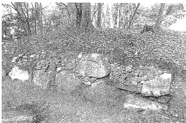
郭の周囲に検出された石垣