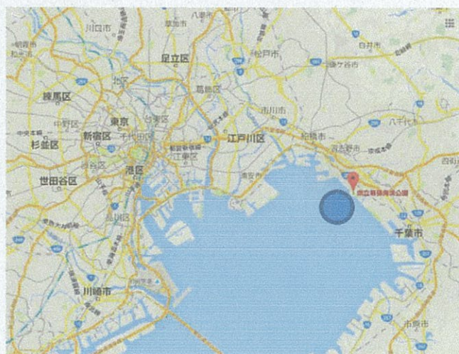
東京湾（幕張海浜公園会場）