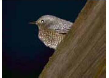
ねぐら入りに来たイソヒヨドリ

すると、暗闇の中に鳥のシルエットが見えたので、ライトで照らしてみると、正体はイソヒヨドリのメスでした。まぶしくて逃げてしまわないように、ライトを少しそらして観察していると、イソヒヨドリはネイチャーセンターの軒下に潜り込んで姿を消しました。どうやら、事務室の横の軒下が、イソヒヨドリのねぐらになっているようでした。