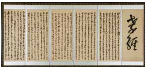
古澤龍巢《孝経》1875（明治8）年 六曲一雙・紙本・墨 2013年 米子市美術館後援会寄贈