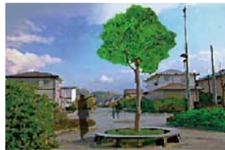
緑化施設 参考イメージ

応募用紙に必要な事項をご記入のうえ、都市計画課（本庁舎2階）までご持参いただくか、郵送またはEメールでご応募