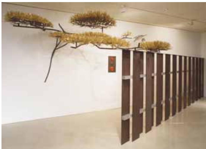
《マツタカ》 1997年 鉄・真鍮線・アルミニウム・プリント合板・プラスチック・火災報知器（ベニヤ・水性塗料） 266 × 780 × 275cm