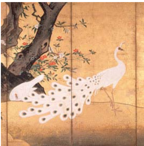
雲谷等璠《孔雀図屏風》(左隻部分) 江戸時代 17~18世紀 八曲一双 各縦159.3×横542.6 (cm)