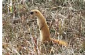
辺りをうかがうチョウセンイタチ