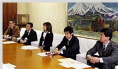
宇田川青少年育成会の皆さん

宇田川青少年育成会の皆さんは、平成6年の沖縄県読谷村楚辺区こども会との交流をきっかけに、相互の生活文化を理解することで連帯意識を高揚し郷土愛護の心情や行動を培うと、地元住民の支援を受け、毎年楚辺区との体験交流や芸能交流を行なっています。