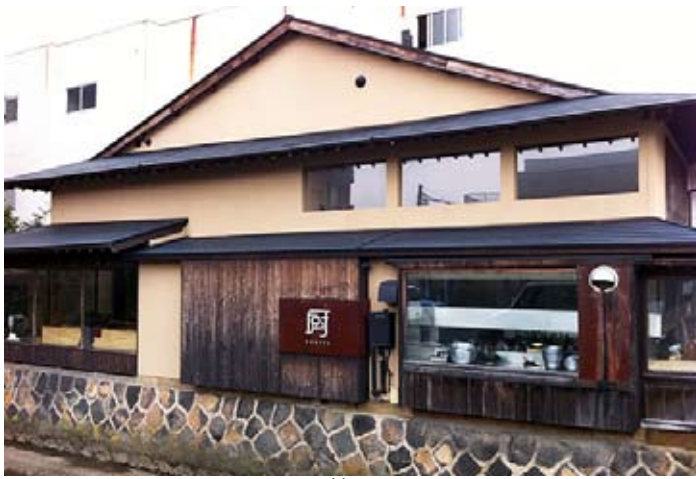
受賞施設：「 くりや 厨」(尾高町1番地)

この施設は尾高町の旧加茂川沿いにあり、古民家を飲食店に再生したものです。建物外観や看板の色彩・デザインは、旧加茂川・石垣・橋などの周囲の景観要素や近隣建物と調和するように配慮されています。加えて大きなガラスや照明の設置によって現代的な美しさも上手に盛り込んでいます。旧加茂川沿いの歴史的な景観形成に寄与する施設として高く評価できます。