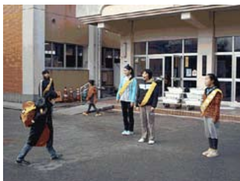
■青少年育成米子市民会議(☎23-5441)

も、あいさつを交わすことで仲よくなれた人がたくさんいます。あいさつをするということばかりなので、これからも義方小学校がたくさんあいさつをする学校になり、人と人との絆を深めていきたいです。