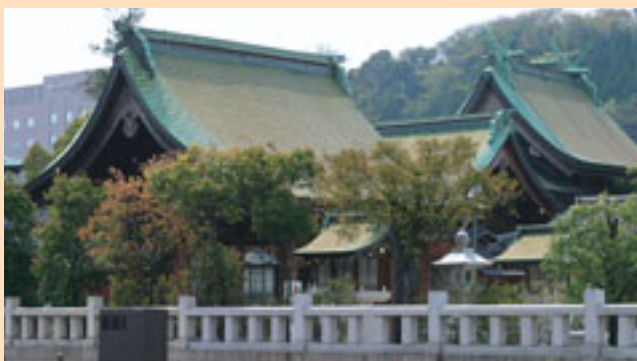
加茂町にある賀茂神社