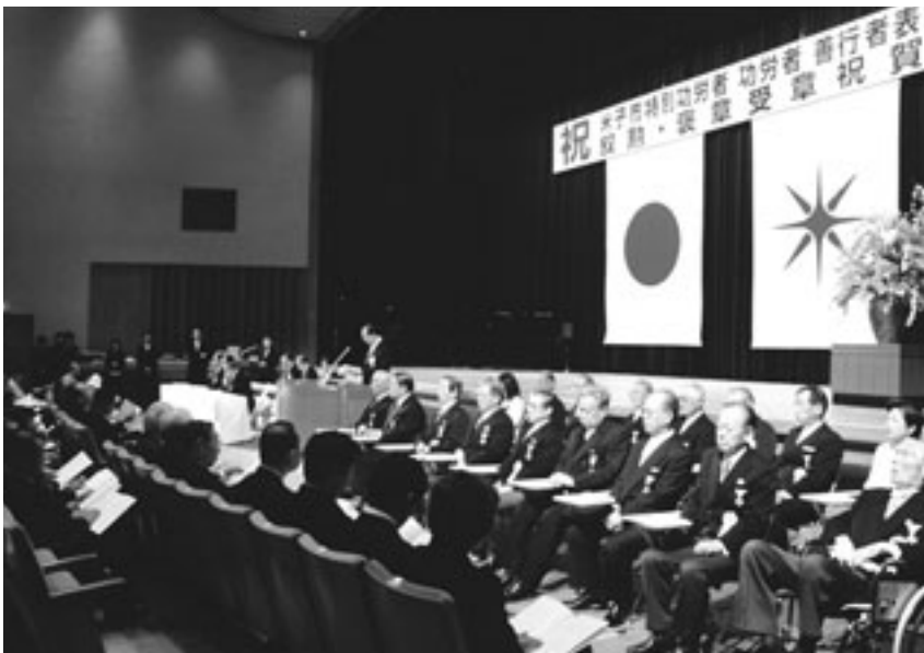
4月1日に公会堂で執り行われた表彰式

市制記念日にあたる4月1日、公会堂で「米子市特別功労者・功労者・善行者表彰式」が執り行われ、市政の発展に多大な功績があった、60人と9団体の皆さんが表彰されました。また、併せて国の栄典である叙勲や褒章を平成15年中に受賞された皆さんをお祝いする「叙勲・褒章受章祝賀式」が行われました。このたび表彰・受章された皆さんは、次のとおりです。 (順不同・敬称略)