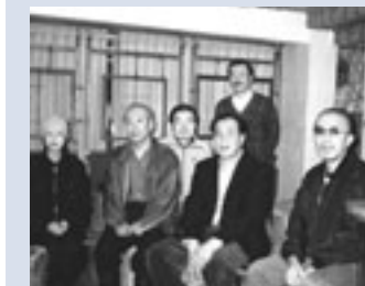
わらい通り協議会のみなさん

平成11年には、町内の空き店舗を借り、会員のアイデアとボランティア活動で休息所「笑い