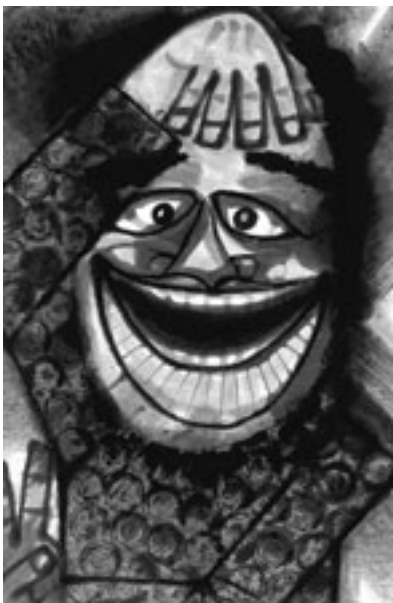
丹慶三揚 作「作品（或る画家[自画像]）」 制作年不詳 91.5×60.8(cm)紙本・淡彩 米子市美術館 蔵