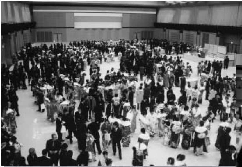
交流会会場内の様子

今日、この感激を今後の私たちの人生に活かし、名実共に成人となることを決意して誓いの言葉といたします。