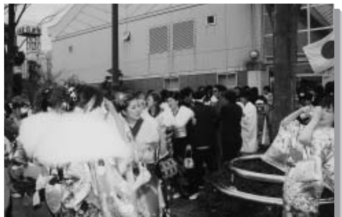
会場周辺での様子