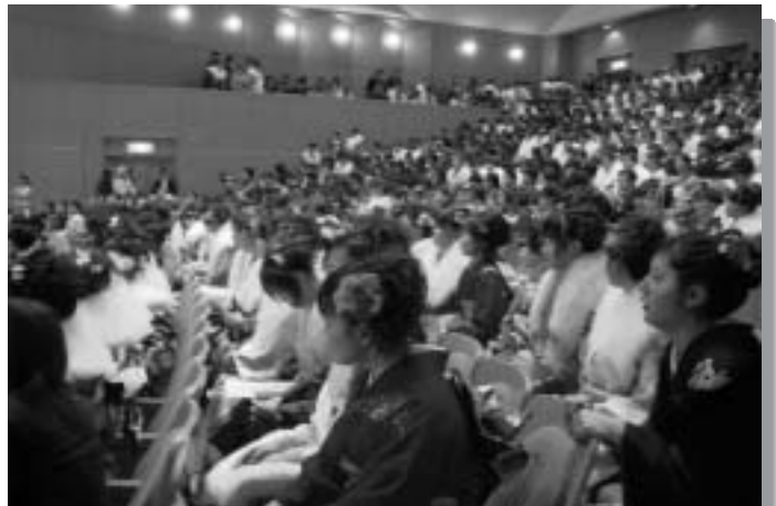
新成人で満員の式典会場

式典が終わると、会場をビッグシップに移し、交流会が開催されました。交流会では、久しぶりに出会う旧友と語る場の雰囲気作りとして、中学校区ごとのテーブルが設置されました。成人にちなんだゲーム大会も行われ、新成人の皆さんは、懐かしい恩師や同級生と再会し、一緒に成人となることを祝い合い、和やかな時間を過ごしました。