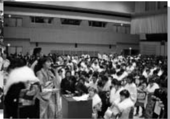
ビンゴ大会で盛りあがる新成人