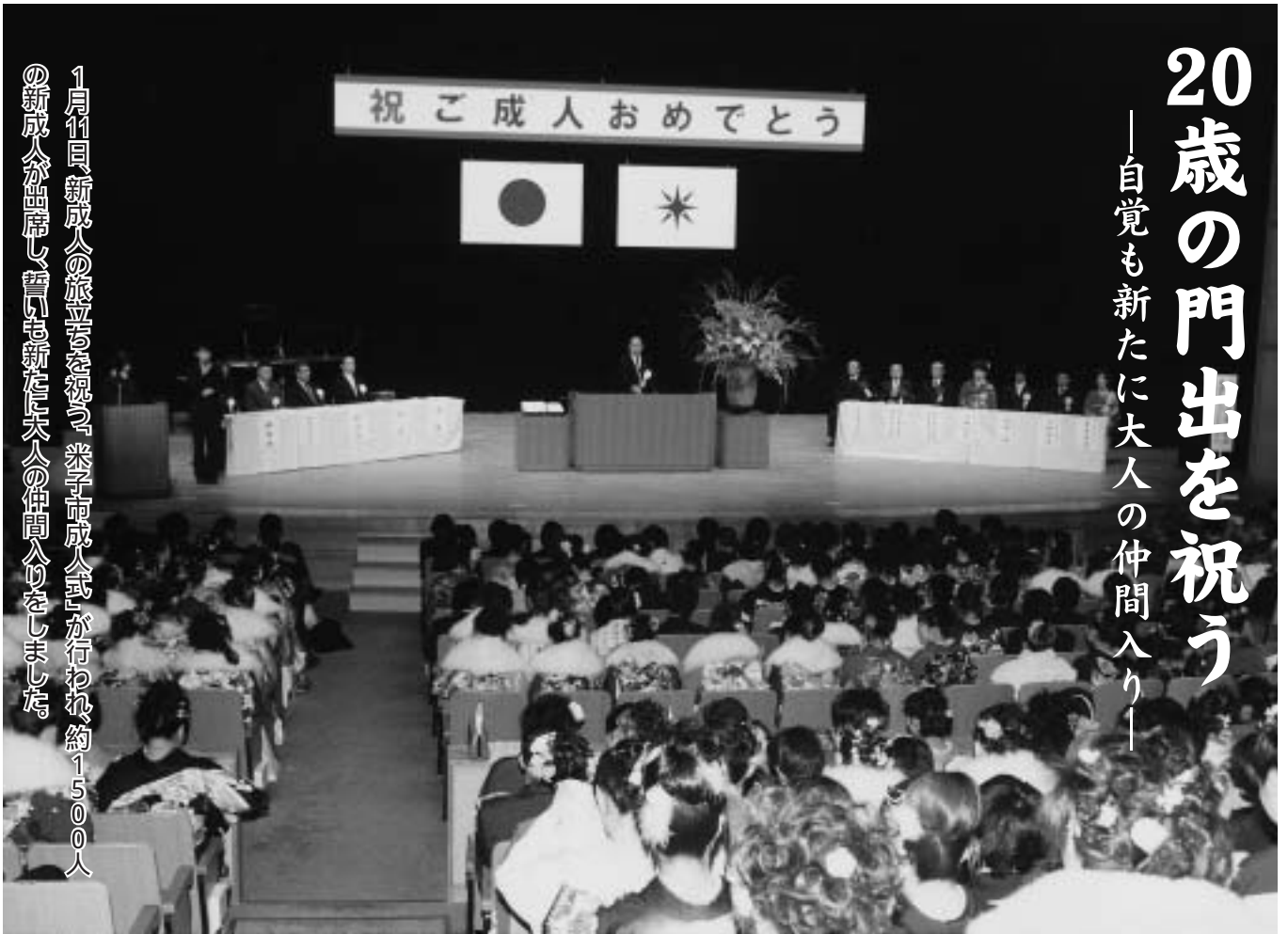
市長から激励の言葉

1月11日、新成人の旅立ちを祝う「米子市成人式」が行われ、約1,500人の新成人が出席し、誓いの新たな大人の仲間入りをしました。