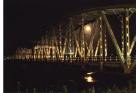
平成17年度 最優秀賞 檜 宏光さんの作品