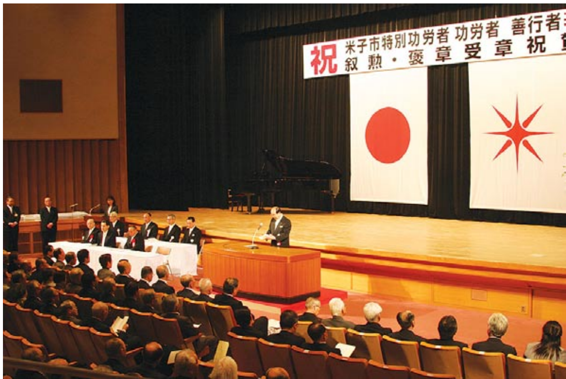
3月31日に公会堂で執り行われた表彰式