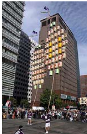
ソウルに舞う米子がいな万灯