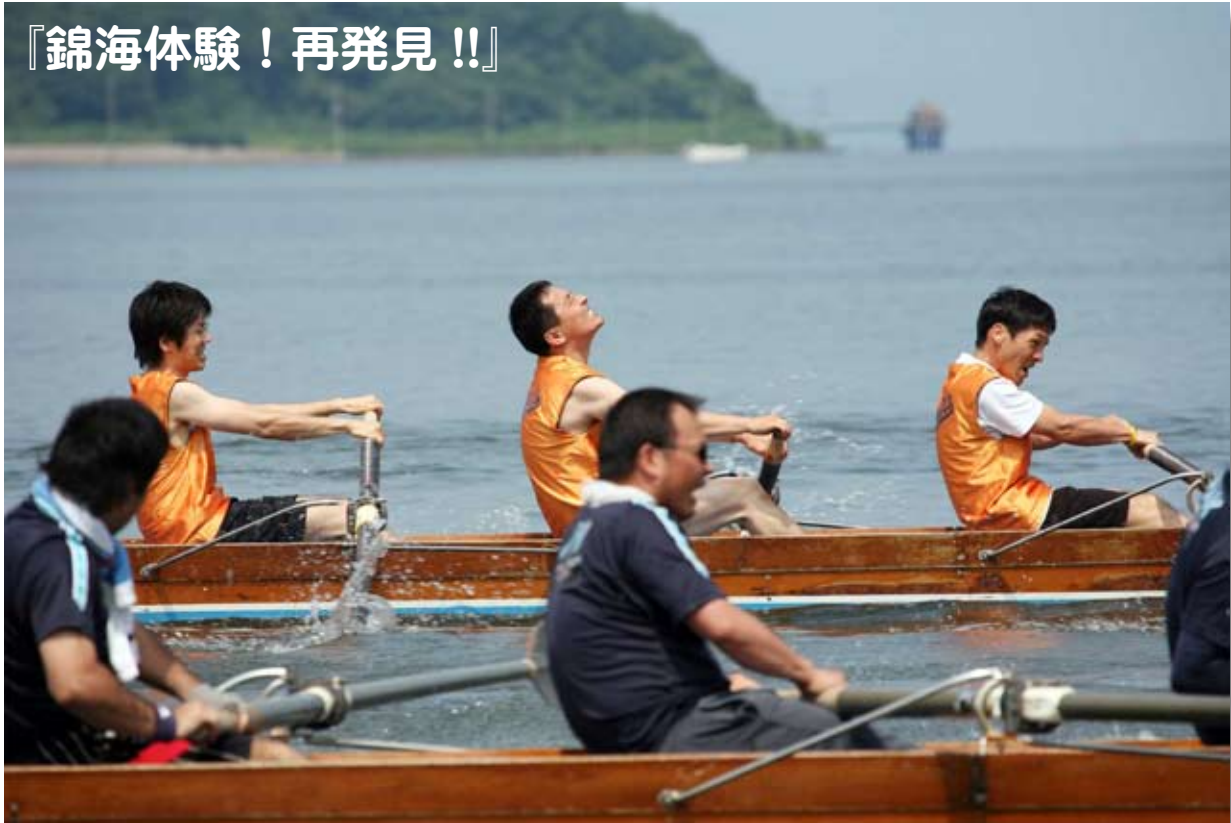
7月13日（日）に開催された「第40回米子市民レガッタ」 こんしん 渾身の力をふりしぼるクルー（湊山公園）