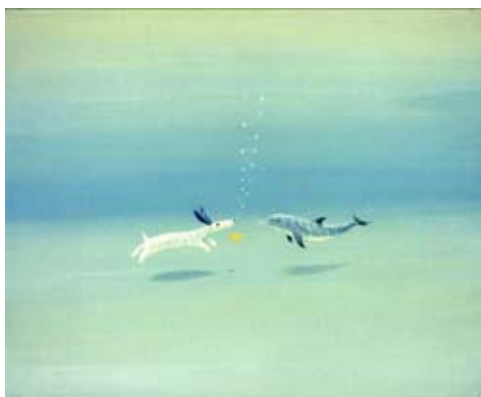
《ジェイクと海のなかまたち》表紙 © YOH Shomei

この作品は、葉祥明のメインキャラクターで、葉祥明自身の分身でもある、白い犬「ジェイク」が主人公の絵本『ジェイクと海のなかまたち』の表紙の原画です。いつもは地上にいるジェイクが、海からのメッセージを伝える大切な役目を果たすため、イルカやアシカなど様々な海の仲間たちと一緒に泳ぎます。