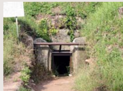
岩屋古墳の石室入口