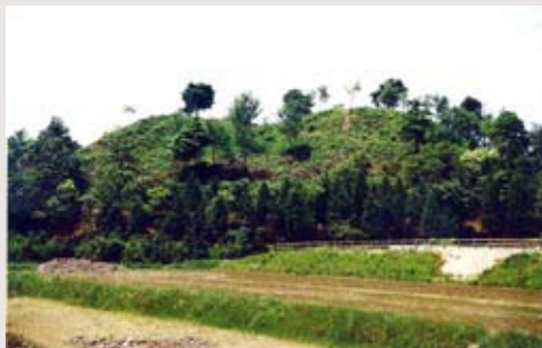
群中最大の向山4号墳

淀江町福岡に所在する、古墳時代の終り頃（5世紀末から6世紀末頃）に築かれた山陰を代表する古墳群です。平成7年に伯耆古代の丘公園として園路や解説板が整備されています。