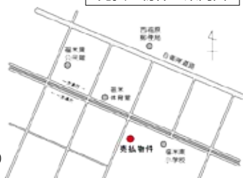
売払物件の案内図