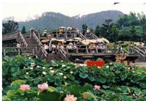
伯耆古代の丘公園の蓮池