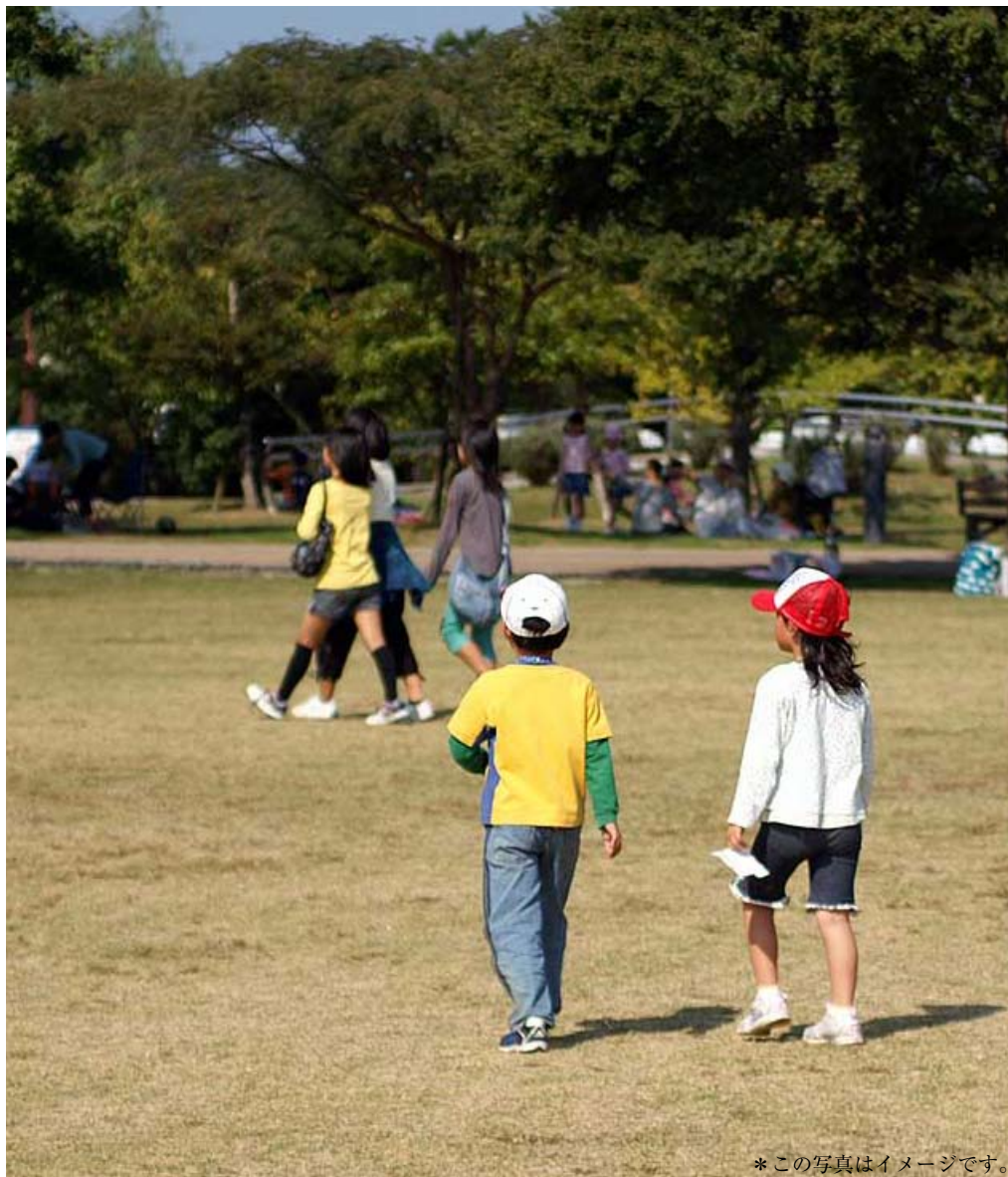
*この写真はイメージです。