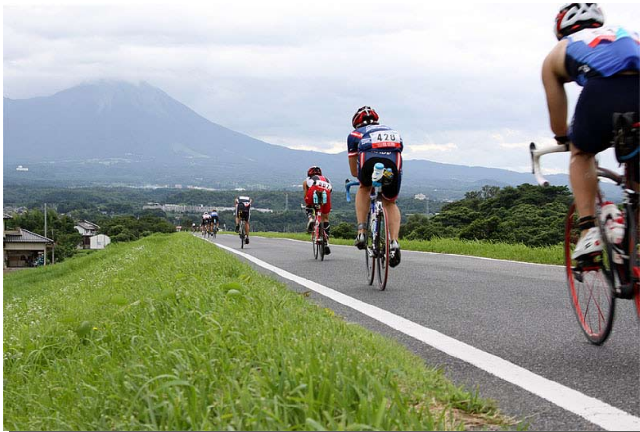
大山に向かって疾走するアスリートたち（八幡橋付近）