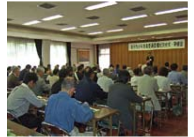
委嘱状交付式の様子

は、日ごろから地域の子どもの声かけや、昼間や夜間の街頭補導活動をしていただき、青少年の非行防止や地域での青少年に有害な社会環境の浄化など、大変なご協力をいただいています。