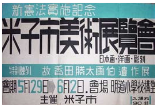
新憲法実施記念米子市美術展覧会ポスター 1947(昭和22)年開催

1947(昭和22)年、明道小学校講堂を会場に新憲法実施記念米子市美術展覧会が開催されてから、今年で50回目を迎えます。現在では米子市の美術の祭典として毎年の恒例事業となり、“市展”という愛称で広く市民に親しまれ、洋画・日本画・書・写真・工芸・彫刻の6部門にわたる多彩な作品が出品されています。