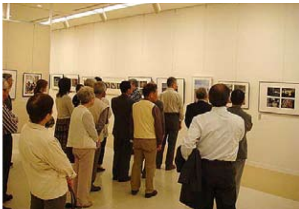
第49回米子市美術展覧会会場風景

米子市美術展覧会(市展)は、広く市民のみなさまから美術作品を募り、発表と鑑賞の場を設けることにより、美術の振興に寄与することを目的に開催している公募展です。